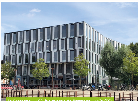
Le Bretagne - 163, bis avenue de Bretagne - Lille (59)

Au niveau locatif, le taux d'occupation brut de votre SCPI a légèrement progressé pour atteindre 90,8 % au 3 ème trimestre (contre 90,4 % au 1 er semestre 2021). Ce taux conforte une fois de plus l'attractivité du patrimoine de votre SCPI et son adéquation avec la demande du marché. L'activité locative aura été particulièrement intense ce trimestre pour l'actif Le Bretagne à Lille (59). La velléité de départ d'un des locataires s'est présentée comme une opportunité pour la SCPI : le principal locataire a en effet étendu ses surfaces prises à bail, tout en permettant la sécurisation de son flux locatif pour une période ferme de 6 ans.